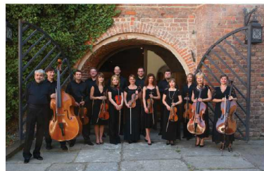
Orkiestra Kameralna WRATISLAVIA

Po raz siedemnasty rozpocznie się dzisiaj o godz. 20 Festiwal Muzyki Kameralnej „Wieczory w Arsenale”