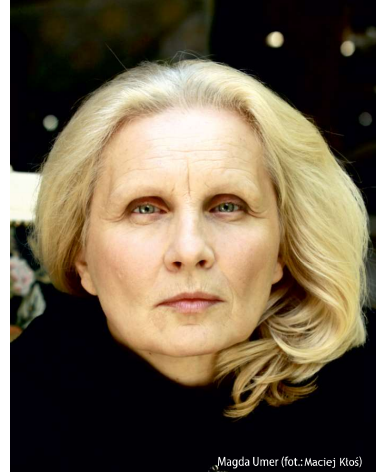
Magda Umer