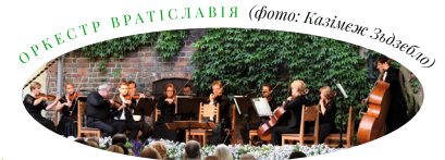
ОРКЕСТР ВРАТІСЛАВІЯ

Л. Я. Палеревський – Сюїта G-dur для струнного оркестру К. Сен-Санс – Інтродукція та Рондо Капрічіозо оп. 28 Г. Веневський – Варіант на оригінальну тему оп. 15 Ф. Мендельсон-Бартольд – VIII Симфонія для струнних D-dur MWV N8